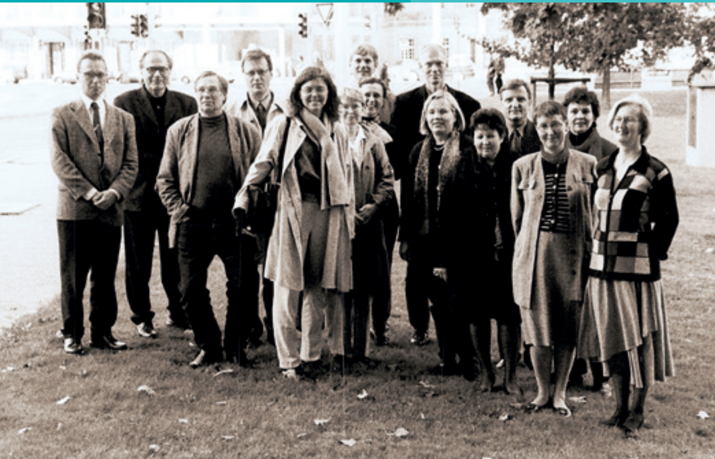
Opintomatalla Leipzigiassa 2002.