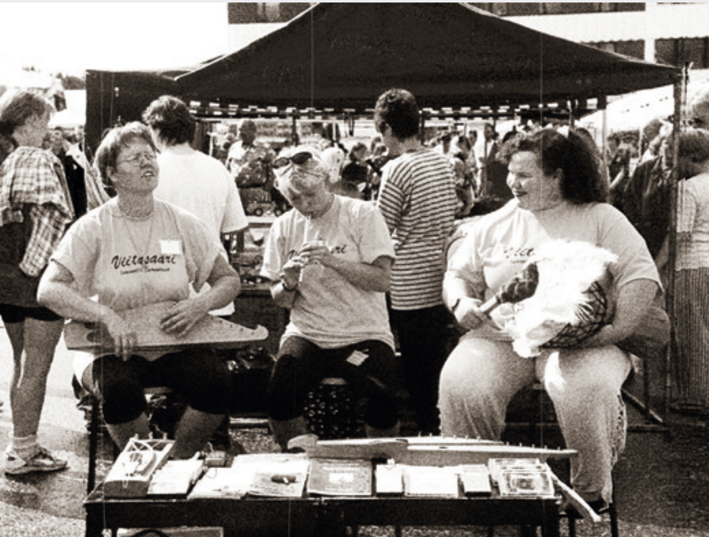
Elävä Kaupunkikeskusta tutki Suomen torien tilanteen vuonna 2006. Kuvassa Viitasaaren torielämää.

Suomessa kaikki on suunniteltu jättiläisille. Kasvuvaraa on jätetty. Alueet, joille toiminta suunnitellaan ja rakennetaan, ovat laajentuneet. Ihmiset liikkuvat entistä suuremmalla säteellä. Näen huonona ilmiönä kaupan ketjuuntumisen: kaikkialla on samanlaista. Sama juttu aina 200 kilometrin säteellä.