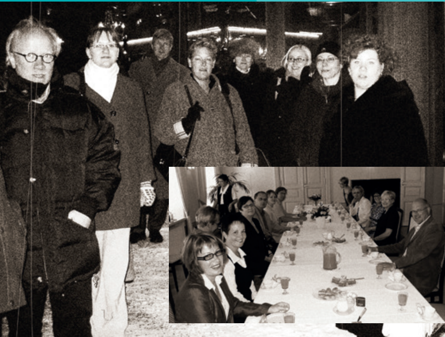
Kaupunkikeskustojen toiminnanjohtajat tapaavat vuosittain ammattikuntana.

Kolmikantamallin – kaupunki, kiinteistöt, kauppa – tuominen Suomeen vaati valtakunnallisten toimijoiden vakuuttelua. Kaupungeissa myös vallitsi ”ensin pitää hoitaa perusjutut” -ajattelu. Vaikka kaupunkien virkamiehet olivat tietoisia keskustauudistuksen mahdollisuuksista, päättäjät jarruttivat.