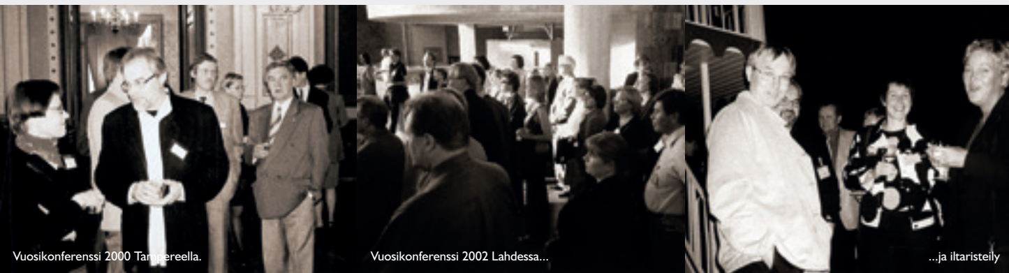
Vuosikonferenssi 2000 Tampereella.