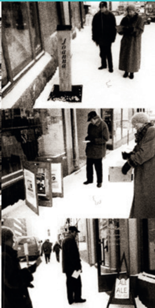
Elävä Kaupunkikeskusta panostaa kaupunkikuvan kehittämiseen.

aiistavissa, että EKK:sta muodostuisi tavaratalojen ja hypermarketien vastainen rintama.