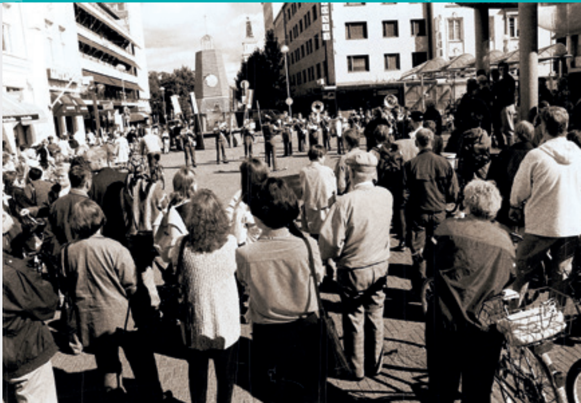
Tapahtumia Oulun Rotuaarilla.