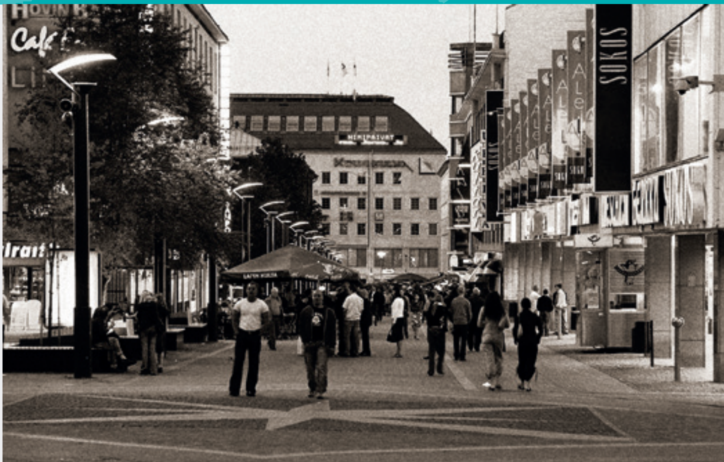
Jyväskylän kävelykeskusta on onnistunut.