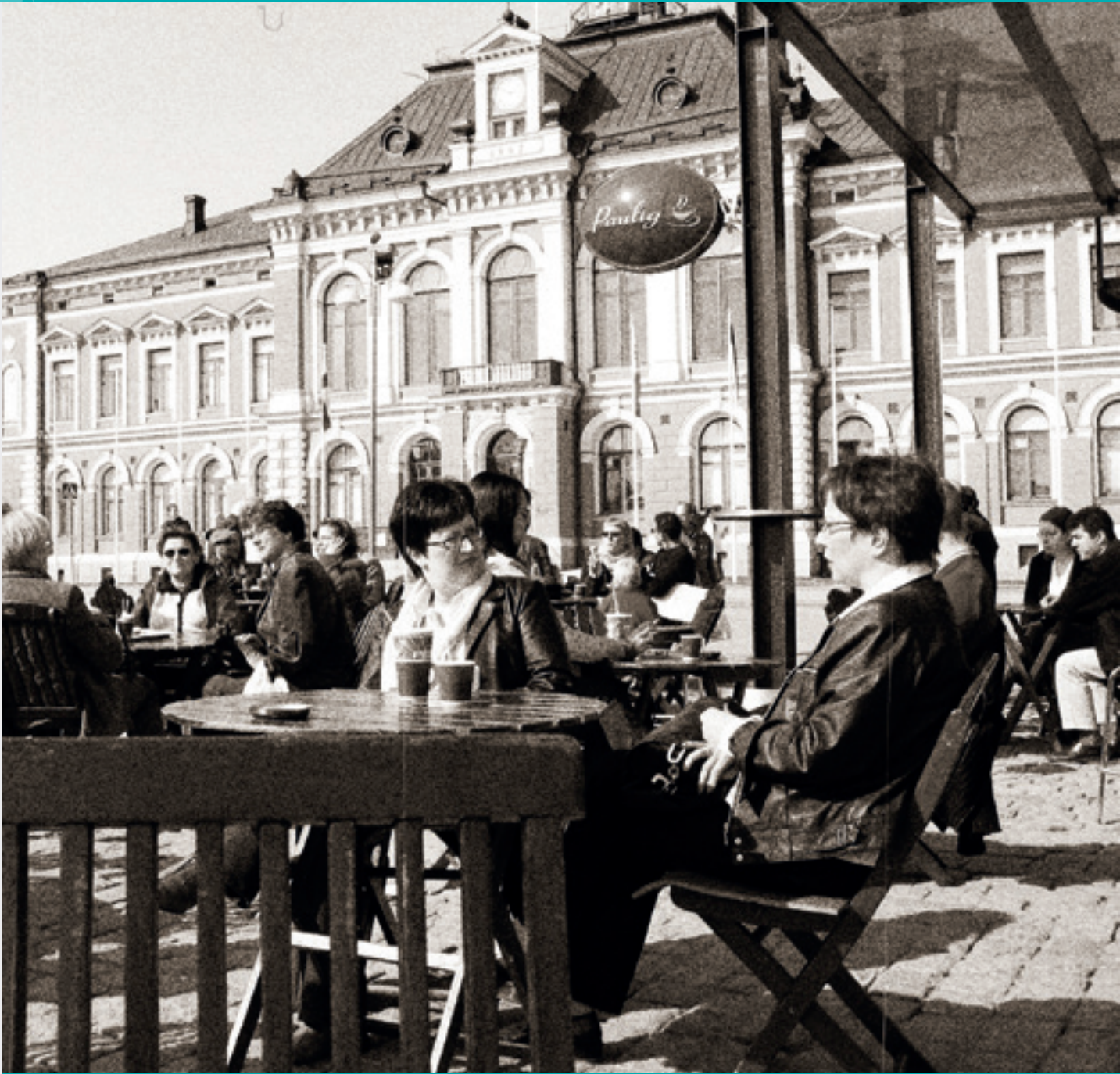
Millainen palvelu? Millaiset kaiteet, millaiset tuolit, millaiset aukioloajat, millaiset yrittämisen ja asiainnin puitteet? Näistä keskustellaan.