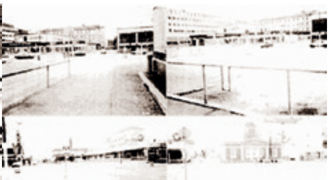
Kaupunkikeskustojen kehittämistyölle oli Suomessa tilaus. Kaupunkikeskustan muodonmuutos toteutettiin esimerkiksi aikataululla Kajaanissa. Uudistus sai 1999 ensimmäisen Elävä kaupunkikeskusta -palkinnon.