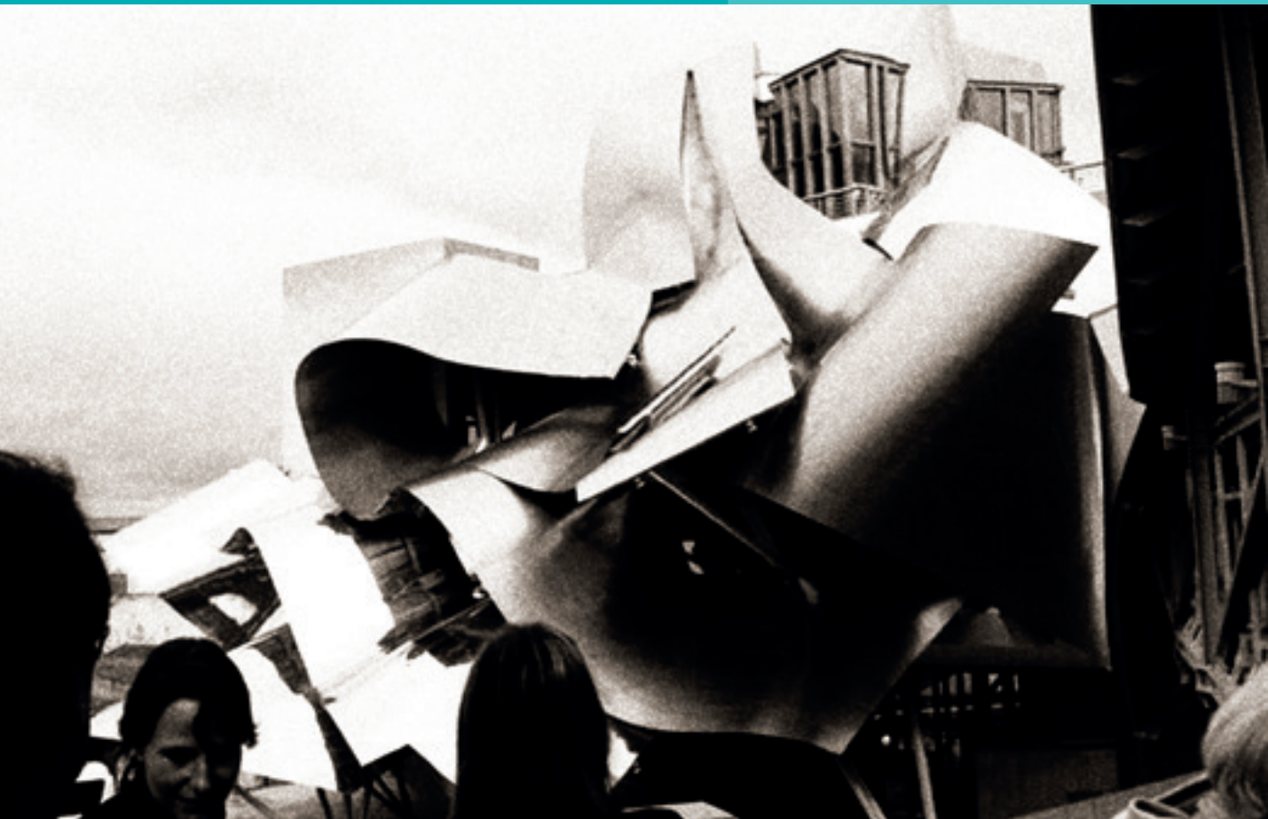
Yhdistyksen opintomatalla Bilbaossa 2006.

Yhdistyksen toiminta lähti vauhdikkaasti käyntiin heti perustamiskokouksesta lähtien ja kiinnostus keskustojen kehittämiseen on ollut kiitettävää koko yhdistyksen kymmenvuotisen historian ajan.