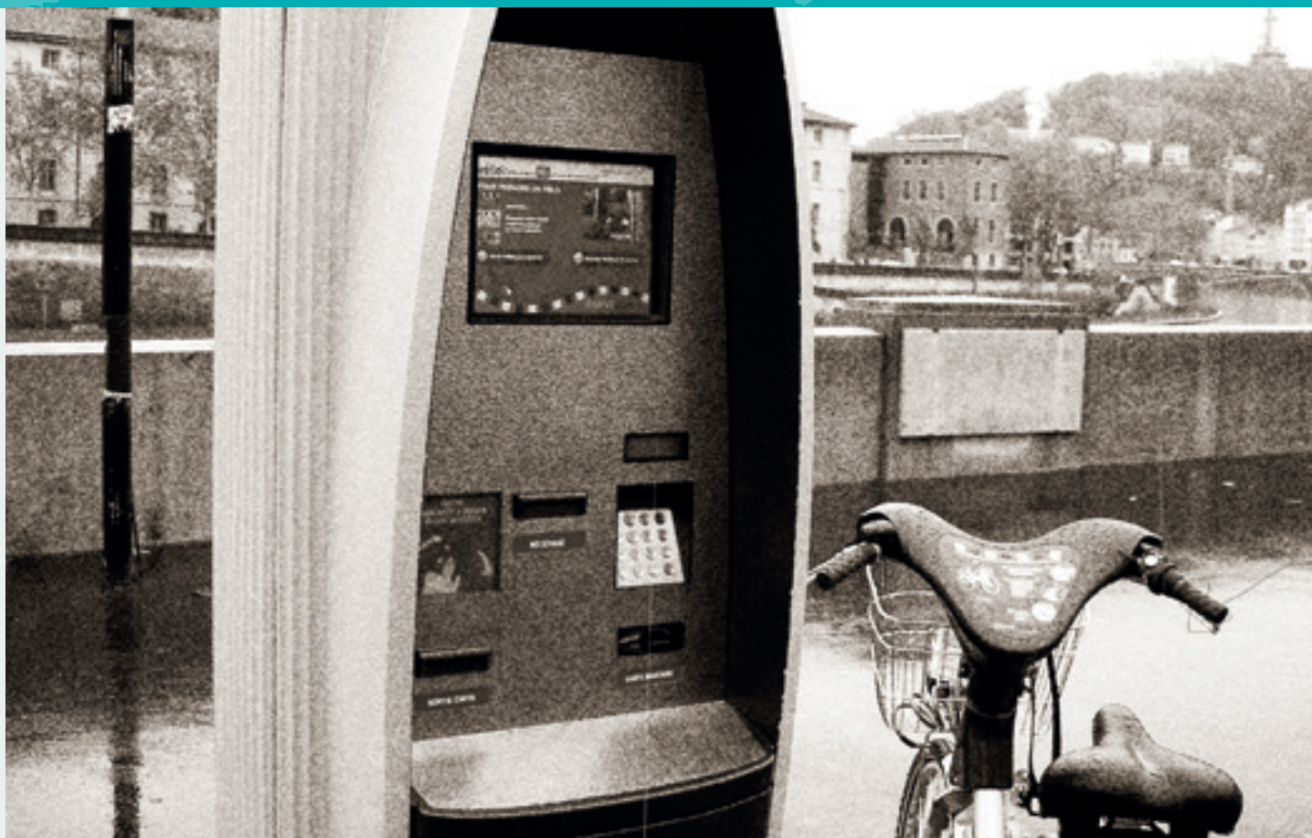
Ulkomaanmatkoilla kerätään isoja ja pieniä ideoita. Kuvassa polkupyöräautomaatti Lyonissa.