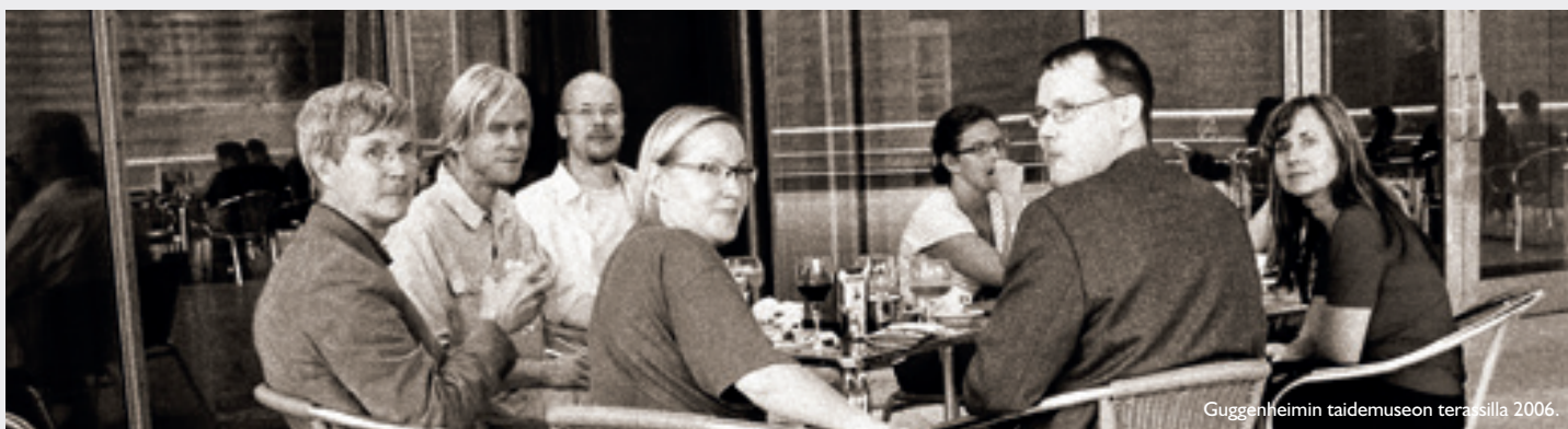
Guggenheimin taidemuseon terassilla 2006.

Perustettavan Elävä Kaupunkikeskusta ry:n ensimmäisen vuoden toimintabudjetti oli iso: jäsenmaksujen piti tuottaa 50.000 euroa, ministeriöiden tuki oli 50.000 euroa ja seminaarien tuotoksi arvioitiin 3500 euroa. Muilta osin kuin jäsenmaksujen osalta arvio toteutuikin. Jäseniä saatiin ensimmäisenä toimintavuonna puolensataa, mikä oli puolet tavoitteesta. Muutamana ensimmäisenä vuonna kauppa- ja teollisuusministeriö ja ympäristöministeriö olivat merkittäviä toiminnan rahoittajia.”