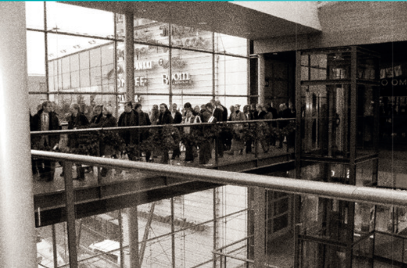
Kauppaeskuskierroksella. Vuorossa Iso Omena.

Pyrimme eri osapuolten yhteistyön kehittämiseen ja asiantuntemuksen lisäämiseen asioissa, jotka liittyvät kaupan toimintaperusteisiin sekä sijoittumiseen.